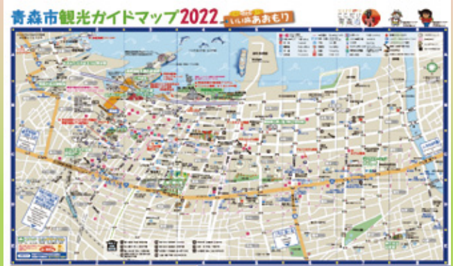
2022年の観光ガイドマップ「いい旅あおもり」

詳細は青森観光コンベンション協会(☎017-723-7211)までお問い合わせください