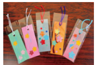
道真ねぶたとねぶたしおり