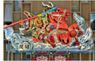
①青森空港(到着ロビー) 【関羽】 監修:福士 裕朗 制作者:長内 大

ねぶたの家W・ラッセにて展示されていたミニねぶたが6月17日(月)から青森空港・新青森駅・津軽海峡フェリーの3カ所で1台ずつ展示されています。展示期間は8月18日(日)までとなっています。お立ち寄りの際は若手制作者の力作をぜひご覧ください。