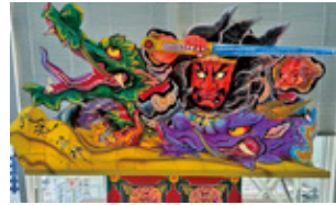
②新青森駅(待合室前※改札の中) 【加藤清正】 監修:北村 春一 制作者:北村 登志枝