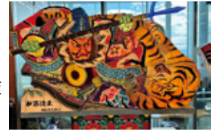
③津軽海峡フェリー(3Fロビー) 【龍飛の黒神】 監修:林 広海 制作者:成田 雅英

ねぶたの家 W・ラッセ 青森市安方 1-1-1 ☎ 017-752-1311 https://www.nebuta.jp/warasse/