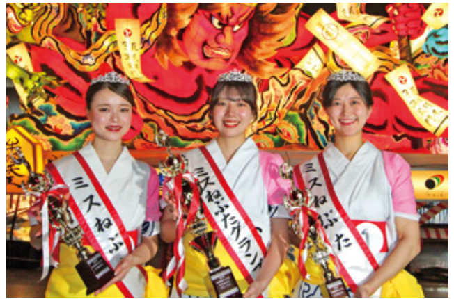
2024 ミスねぶたの皆さん